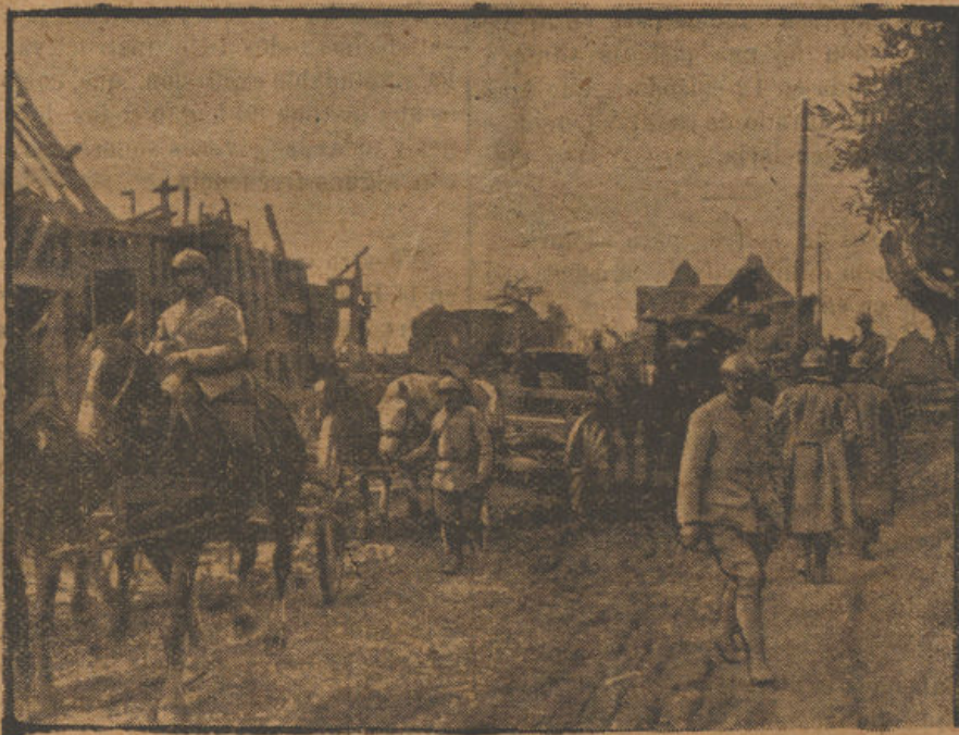
Atrevesando un pueblo

Suma y compendio de todas estas maldades era el tío «Pelusa», un viejo más viejo que Matusalén, avaro y usurero, duro de corazón, implacable é insensible, terror del pueblo todo, al que tenía metido en un puño, y si no en un puño, sí en sus arcas, que no había nadie que libre de sus uñas estuviera; pues unos le debían las tierras, otros la casa, otros los ganados, y otros, los ganados, las casas y las tierras, y dinero todos, todos, todos, sin la excepción de uno solo de ellos, víctimas todos: viudas, huérfanos, desvalidos, de su terrible usura, alivio momentáneo de su miseria, como droga sedante que consuela al pronto, y a lo largo mata; que no a otra cosa que a esta miseria podían conducir la holgazanería y los vicios de aquellas gentes.