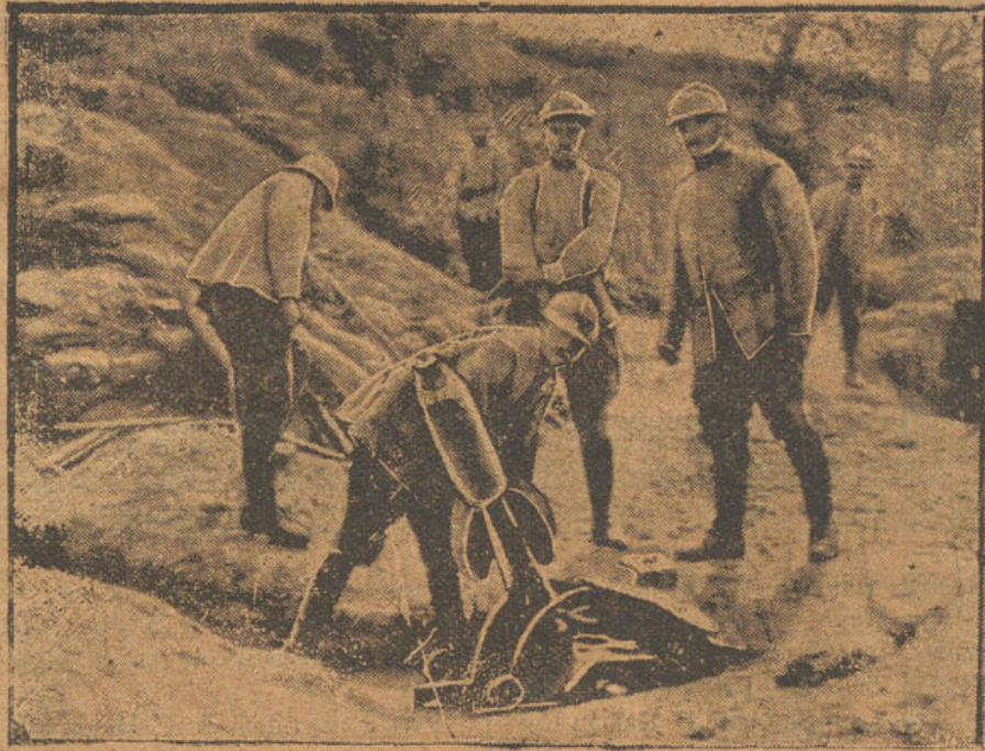
Montaje de un lanza-bombas en terreno conquistado

criaturas que, sin embargo, se completaban hasta cierto punto!