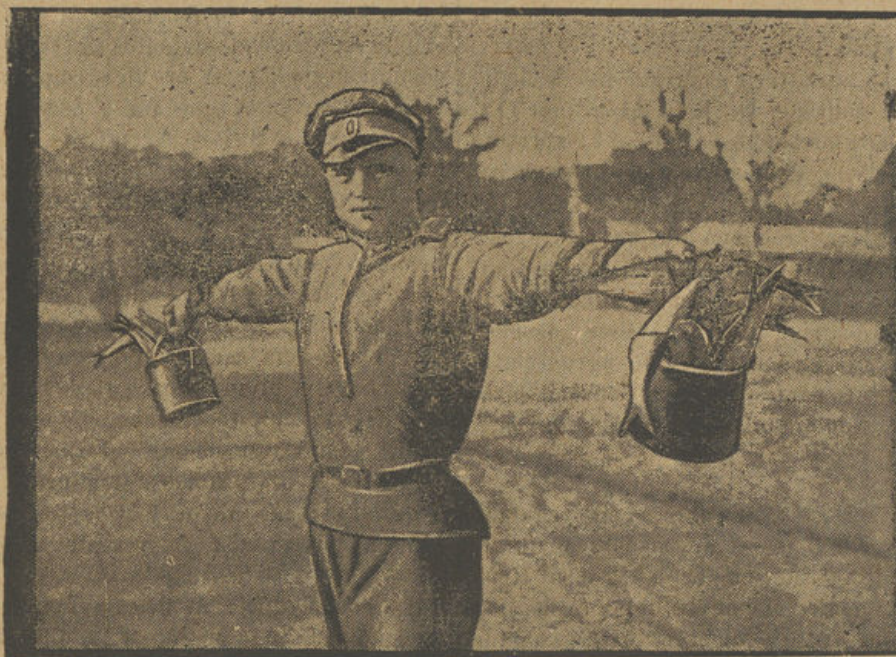
Ordinario de los rusos en Francia.

tander? Tu hermano me encargó mucho que te buscara; después de tantos años de destierro anhela abrazarte. Ya verás cómo se emocionará cuando te vea. ¡Eres el único que no ha muerto estando él allí!