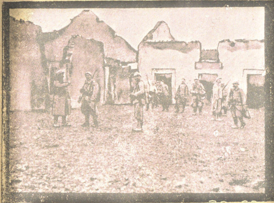
Bajo el fuego en las ruinas del Somme

sin conseguir su objeto, pues todos nos echamos a reír. Y unas chiquelas le gritaban: