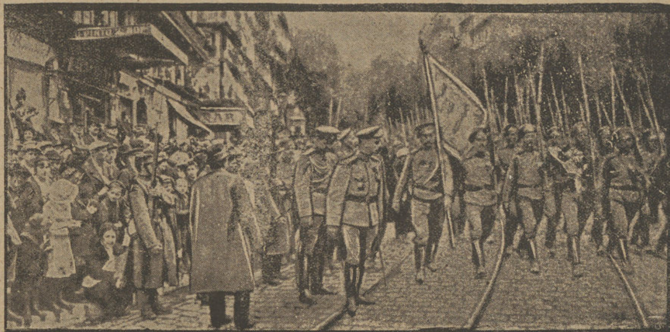
Desfile por las calles de Marsella de los regimientos rusos que van á combatir en Francia

La pequeña, á la vista de la preciosa capota, se reía, mirando afanosa á la oficiala, con esa carcajada alegre y franca que es patrimonio exclusivo de la juventud.