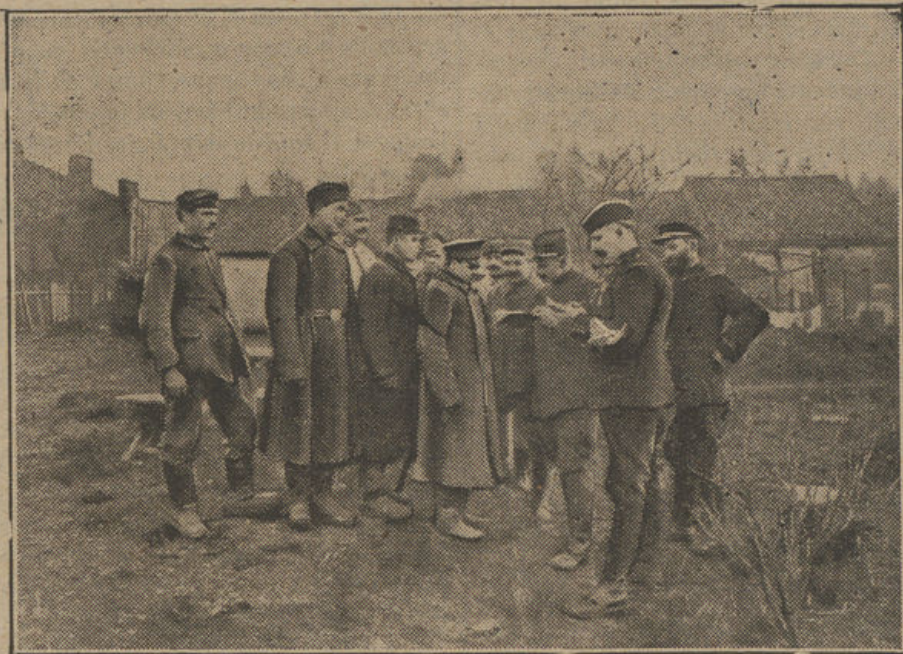
Grupos de soldados rusos prisioneros de los alemanes empleados en trabajos militares en el frente occidental, que lograron escapar y ganar las líneas francesas bajo disfraces.

y en las angustias de la tarea sin respiro, y en las noches de soledad en aquel infecto dormitorio cueva, dominio de roedores y parásitos inmundos, y bajo la manaza sin misericordia del moderno negrero, Juanía, humilde, con la bondad mansa y resignada de todos los suyos, contenía los sollozos, y, bebiéndose en silencio los lagrimones, balbuceaba muy quedito, más con el corazón que con los labios: