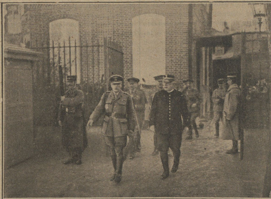
El general Joffre y el general Douglas Haig