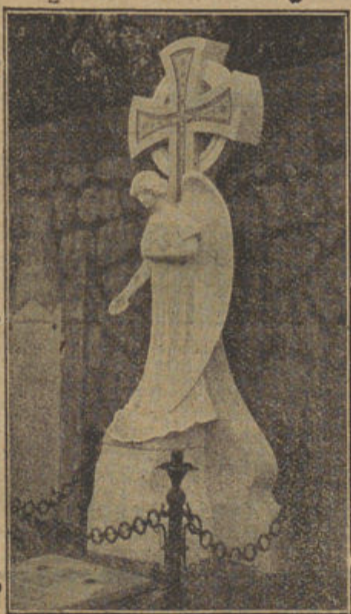
Tumba propiedad de D. Juan Canals — en el Cementerio de S ller —

Adresse T l graphique, ARBONA, Tarascon. — T l phone n.  11. Succursale a REMOULINS. — T l phone n.  7.