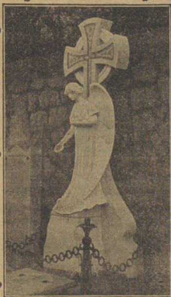
Tumba propiedad de D. Juan Canals en el Cementerio de Sóller

Succursale a REMOULINS. — Téléphone n.º 7.