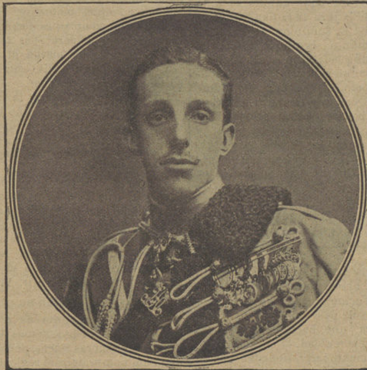
S. M. EL REY D. ALFONSO XIII

El Rey, al primer fogueo, volvió la vista hacia el criminal, al propio tiempo que, con serena visión de aquel peligrosísimo trance, volvía la muñeca izquier-