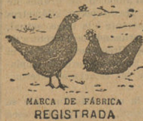
MARCA DE FÁBRICA REGISTRADA

¡¡¡3.000 HUEVOS!!! Primero y único en España (patente por 20 años). Descubrimiento maravilloso, resultados sorprendentes, ganancia segura, ponen todos los días aun que sean los mas frios del invierno. Numerosos certificados, gasto insignificante, pedir folleto explicatorio.