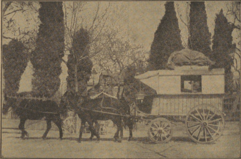
La diligencia de Sóller al salir de Palma en uno de sus últimos viajes.

pacientemente las cuestas, tirada por mulas hastiadas y caballos flacos.