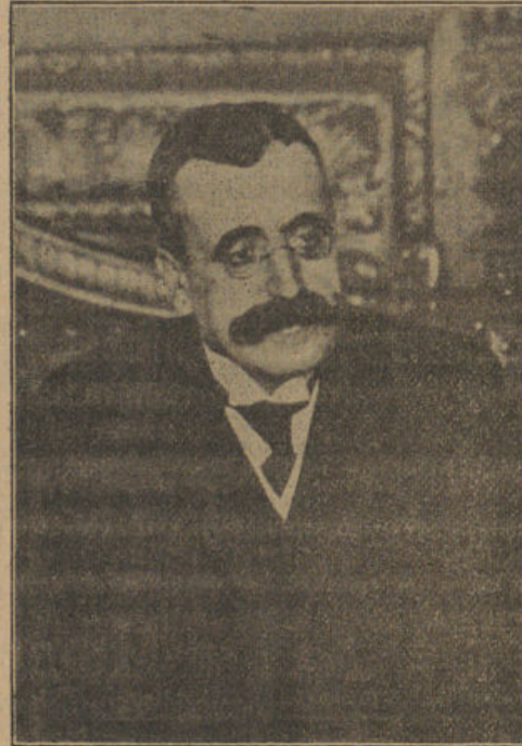
Excmo. Sr. D. José Canalejas

Sabe todo el mundo que el sábado había proyectado reunir el Consejo, y á primera hora de la tarde del viernes, el