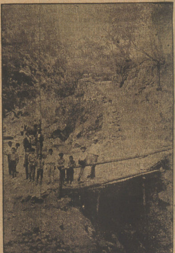
Detalle de las obras a la salida del túnel. La montaña que se vé a la izquierda pertenece a la finca "El Teix", en donde se han efectuado ya parte de las obras de explanación y en cuyo terreno se ha abier- to una gran cantera.