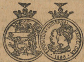
MEDALLA DE ORO.

Se confecciona calzado de todas clases á la medida para caballeros, señoras y niños.