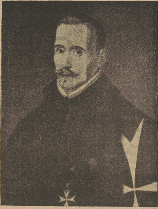
Retrat de Lope de Vega amb l'hàbit de Cavaller de l'Orde de San Joan. (Colecció Lázaro Galdeano).

L'escenari estava format per un entarimat més alt que el nivell del pati. L'orquestra—limitadíssima—quedava sota l'escenari. Aquest estava constituït, com acabem de dir, per un simple entarimat. Mancaven les decoracions—que aparegueren