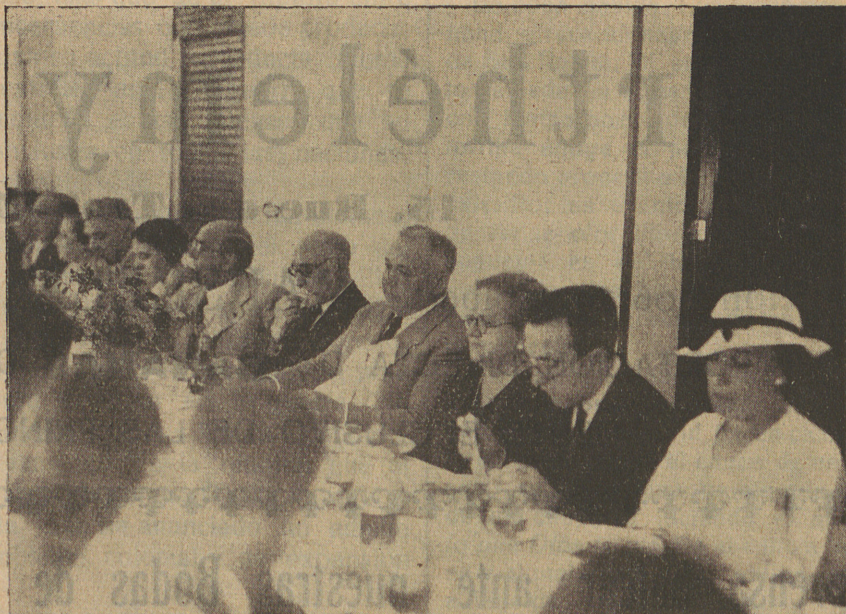
Un detall de la presidència del dinar

Al destapar-se el xampany, el senyor Guillem Colom donà lectura a les nombroses adhesions rebudes, que eren les següents: