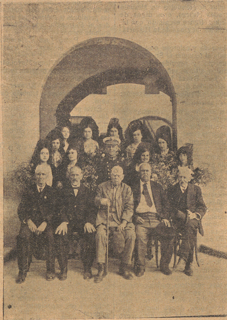
Los marinos pensionados con el Sr. Comandante de Marina de Sóller y las señoritas que actuaron de madrinas

Hace veintiséis años, con motivo de unas huelgas sangrientas que hubo en Barcelona, quedaron en la miseria multitud de obreros, y fué entonces cuando un grupo de personas honorables y entidades económicas, deseosas de apagar el hambre y restañar las heridas materiales y morales de aquellos desgraciados víctimas de la miseria, abrió una suscripción pública que enjugó lágrimas y mitigó dolores; y del sobrante de aquella suscripción instituyeron la Caja de Pensiones para la Vejez y de Ahorros , con el fin de que predicara continuamente al obrero la conveniencia de prevenirse contra los embates de la pobreza por