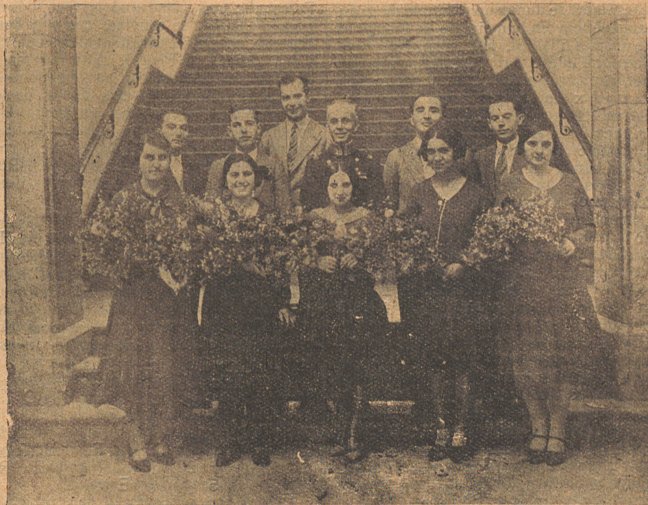
Las señoritas que aportaron su cooperación musical, con el Sr. Comandante de Marina y la comisión de jóvenes delegados para la organización de la fiesta.