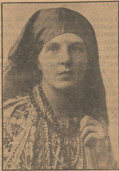
Retrato de la eximia violinista vistiendo uno de los trajes típicos de la mujer rusa.

Esta artista que, por atención a la salud de su hijito, ha decidido vivir en Sóller durante unos años, es un valioso elemento que ha de contribuir en gran manera a la intensificación de la vida musical en nuestra ciudad.