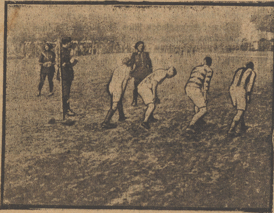
Fiesta esportiva organizada por un batallón de cazadores

un solo hecho verdadero. Lo mismo ocurre con los conciertos de Rosales, en los que nadie atiende, y con las corridas nocturnas, en las que, pasada la mojiganga, se duermen los espectadores a la pálida luz de los arcos voltaicos... Y mientras tanto, la gente de provincias se divierte que es una delicia.