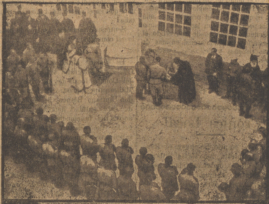
Soldados rusos prestando juramento de fidelidad