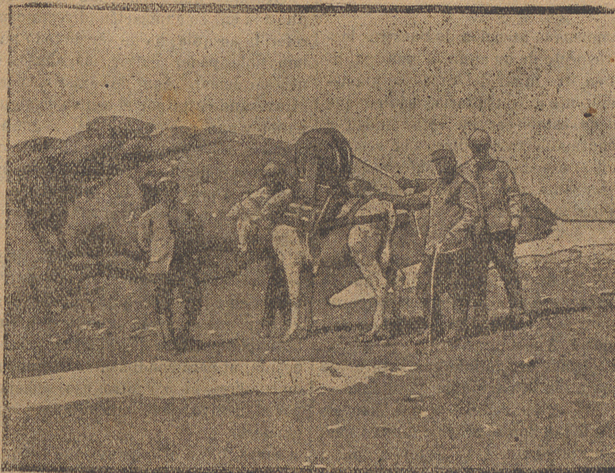
Ejército oriental.—Tendido de una línea telefónica