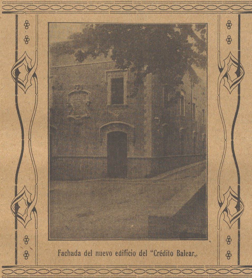
Fachada del nuevo edificio del «Crédito Balear».