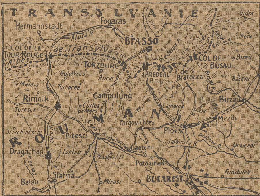
Mapa del frente de Transilvania

tro de ángel, que nunca olvidaré. Sus carnes eran tan transparentes que parecía que un cirio las iluminase por dentro. Tal vez era su alma que resplandecía antes de abandonar el cuerpo. Sus ojos tenían una belleza tal, que pocos hombres los tienen iguales. No se parecía en nada a los niños noruegos. Un rayo de sol penetró por la ventana dorando sus bucles castaños, y el niño siguió con la vista los movimientos de los millares de átomos que en él se agitaban. Junto al enfermo estaba una mujer, que debió ser joven y bonita antes que las penas la envejecieran y las lágrimas marcaran surcos en su rostro. Sus ojos eran negros, la mirada brillante y dulce, como la del enfermito, y cada vez que la tos agitaba su débil pecho, la pobre madre se estremecía como si con un martillo la golpearan. El mayordomo entró y le enseñó el nido.