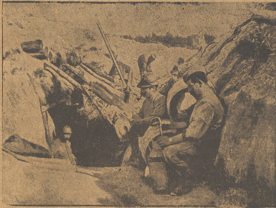
Entrada de un campamento situado cerca de la frontera servia

y salté por la tapia junto al rincón aquel donde, bajo la verde sombra de frondosos tilos y junto a un pequeño estanque, sabía que existía un banco de piedra que por demás me atraía desde que fué testigo de mis horas más felices: allí fué donde me dijo Magdalena «Yo también le amo a usted».