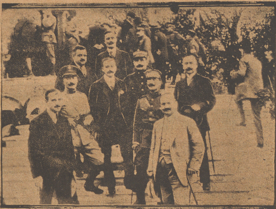
Los miembros del Comité revolucionario de Salónica