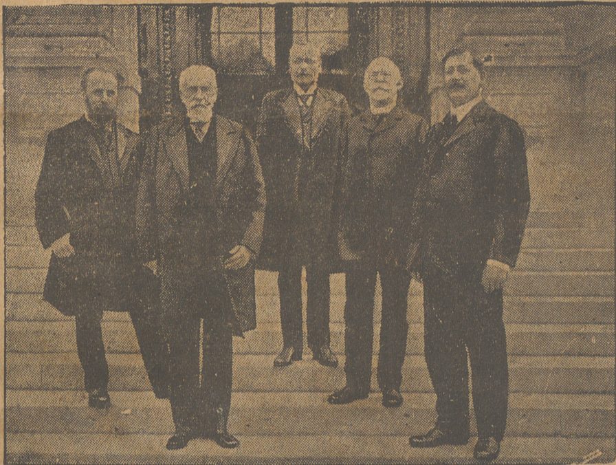
La cuestion del abastecimiento de Suiza