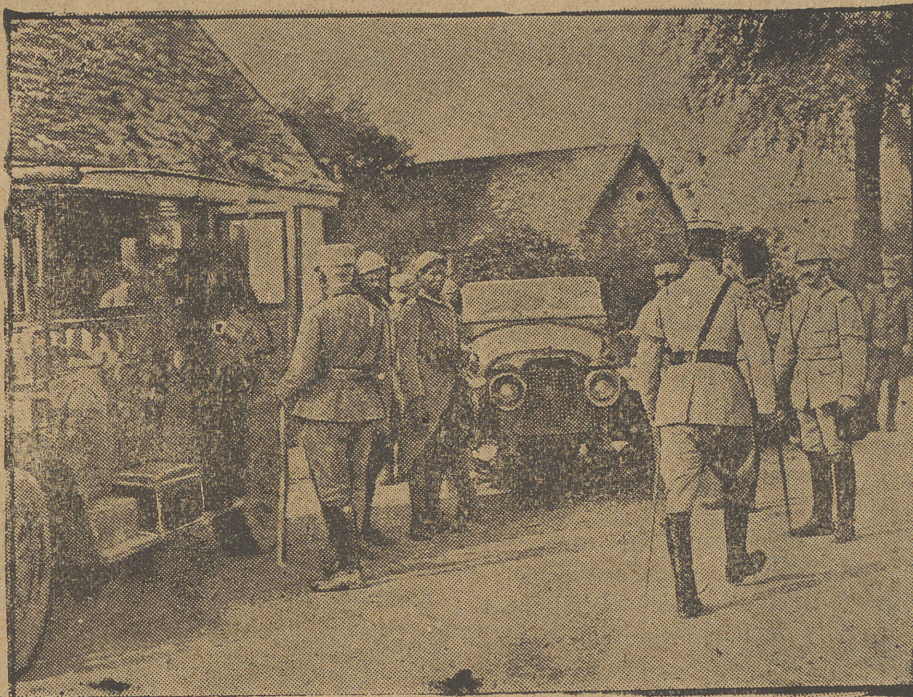
Los ojos de la artillería