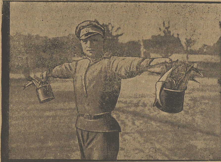
Ordinario de los rusos en Francia.

tander? Tu hermano me encargó mucho que te buscara; después de tantos años de destierro anhela abrazarte. Ya verás cómo se emocionará cuando te vea. ¡Eres el único que no ha muerto estando él allí!