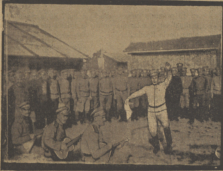
En el campamento de los rusos que fueron á combatir en Francia. La danza nacional.

bien que se casa conmigo; este casamiento es mi garantía de ser buena, y me lo echas en cara como una maldad. ¿Dices que es por cariño? ¡Mentira! No me quieres. Si me quisieras, te alegrarías de mi felicidad.