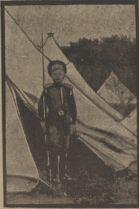
Vigia de un regimiento ruso