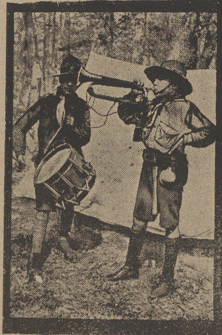
La diana en un campamento

aguardaban y ya se disponían á subir en carruaje cuando vieron llegar hacia ellos á un mozo que vestía la librea de casa del conde.