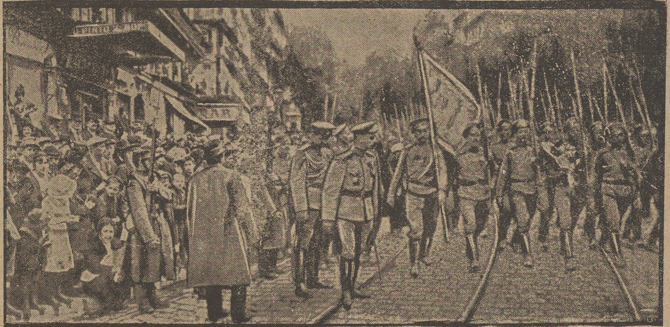
Desfile por las calles de Marsella de los regimientos rusos que van á combatir en Francia

La pequeña, á la vista de la preciosa capota, se reía, mirando afanosa á la oficiala, con esa carcajada alegre y franca que es patrimonio exclusivo de la juventud.