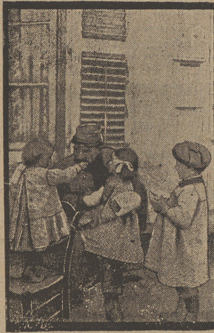
Un herido en la retaguardia

gunda vez me involucraba y decidí demostrarle que eran temerarias y vecinas de la injusticia las opiniones que aquella buena señora tenía de la justicia y de sus auxiliares.