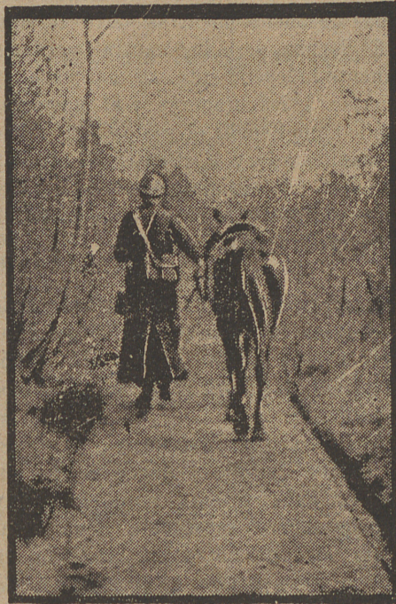
En buena unión en las avanzadas