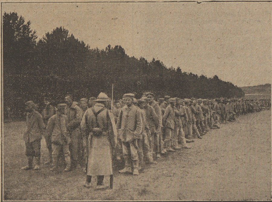
Una columna de prisioneros alemanes conducidos al interior