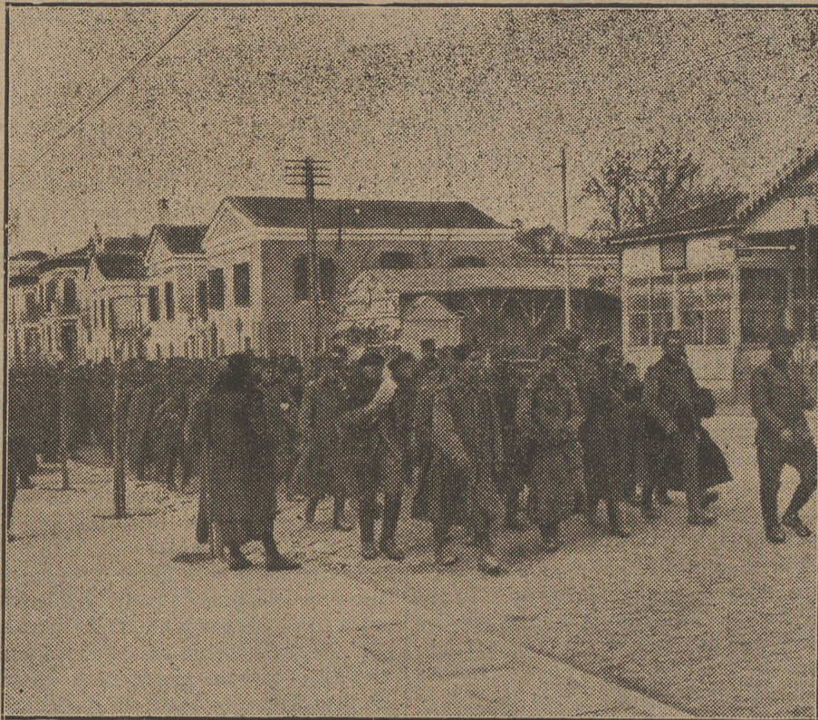
SALÓNICA.—Soldados serbios marchando á su acantonamiento