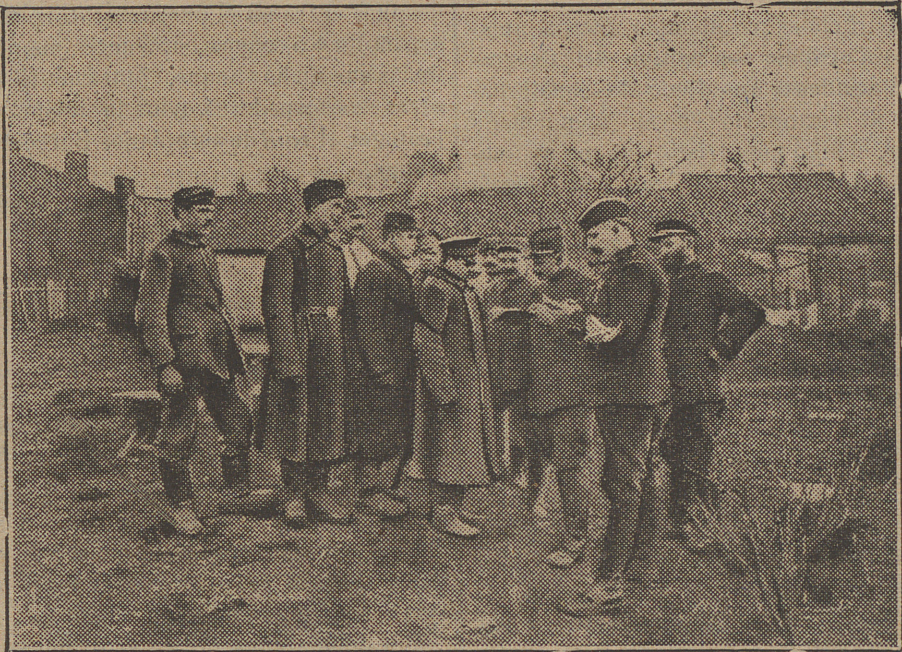
Grupos de soldados rusos prisioneros de los alemanes empleados en trabajos militares en el frente occidental, que lograron escapar y ganar las líneas francesas bajo disfraces.

y en las angustias de la tarea sin respiro, y en las noches de soledad en aquel infecto dormitorio cueva, dominio de roedores y parásitos inmundos, y bajo la manaza sin misericordia del moderno negrero, Juanía, humilde, con la bondad mansa y resignada de todos los suyos, contenía los sollozos, y, bebiéndose en silencio los lagrimones, balbuceaba muy quedito, más con el corazón que con los labios: