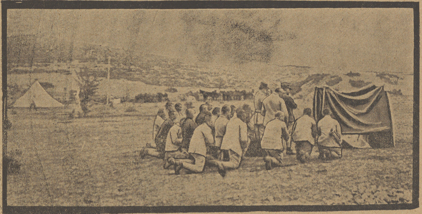
Una misa de campaña cerca de Salónica

da por hacer... y ni siquiera tendrá usted treinta años?