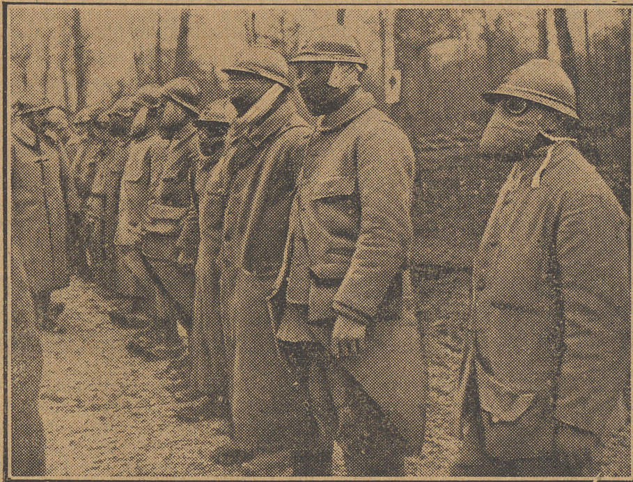
Antes de la partida de los soldados para las trincheras de primera línea, el jefe pasa la revista de las máscaras contra los gases asfixiantes

se deja caer en el sofá y, echando atrás la cabeza y sacando el busto, suspira á la vez que arroja la «echarpe» sobre el respaldo de una «marquesita» y el manguito sobre una butaca.