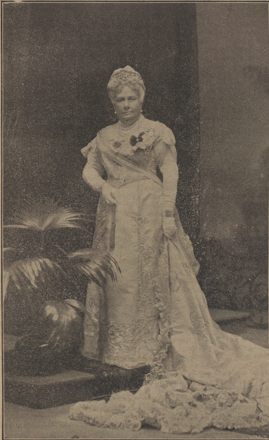
S. A. R. LA INFANTA ISABEL