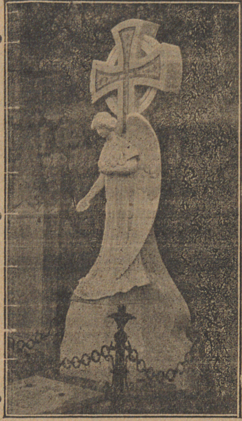
Tumba propiedad de D. Juan Canals en el Cementerio de Sóller

NOTA.—Siempre que el día de salida de Sóller y Cette para Barcelona coincida en sábado de día festivo, retrasará el vapor su salida 24 horas.—La salida de dicho buque del puerto de Barcelona para el de Sóller, será en todos los viajes á las ocho y media de la noche.