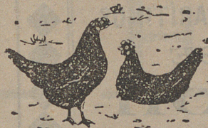
MARCA DE FÁBRICA REGISTRADA