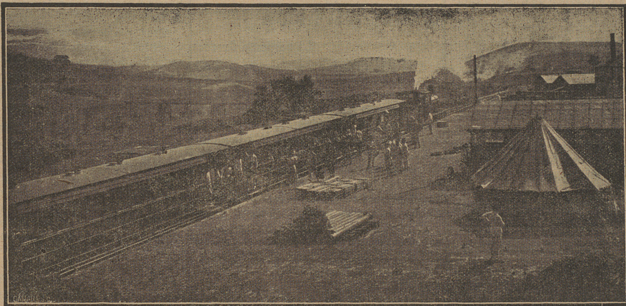
Primera salida del tren de pasajeros de Melilla a San Juan de las Minas.

Efectivamente, al sonar las diez en el reloj de la torre, el colegial echó la cuerda desde la ventana de su cuarto, que estaba en el tercer piso: el externo, que fué también muy puntual, ató a su extremidad el asa de la cesta, y ésta empezó a subir. Pero... el señor rector había salido, como de costumbre, a dar una vuelta por los tránsitos, a la hora de acostarse los colegiales, y por casualidad estaba junto a la ventana del segundo piso perpendicular a la del colegial