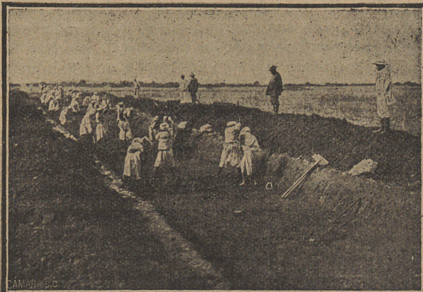
Trabajadores ocupados en la línea férrea de Nador a Zeluán.

«El duque de San Pedro de Galatino ha regresado de Larache, donde ha permanecido un mes estudiando aquel territorio.