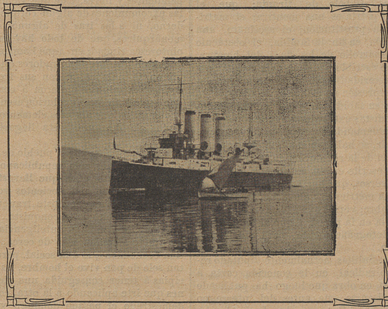
El Crucero "Reina Regente"

Honramos hoy nuestras columnas reproduciendo la fotografía del Reina Regente , crucero que acaba de terminarse en el arsenal del Ferrol y cuyas pruebas definitivas se realizaron recientemente con lisonjero éxito.