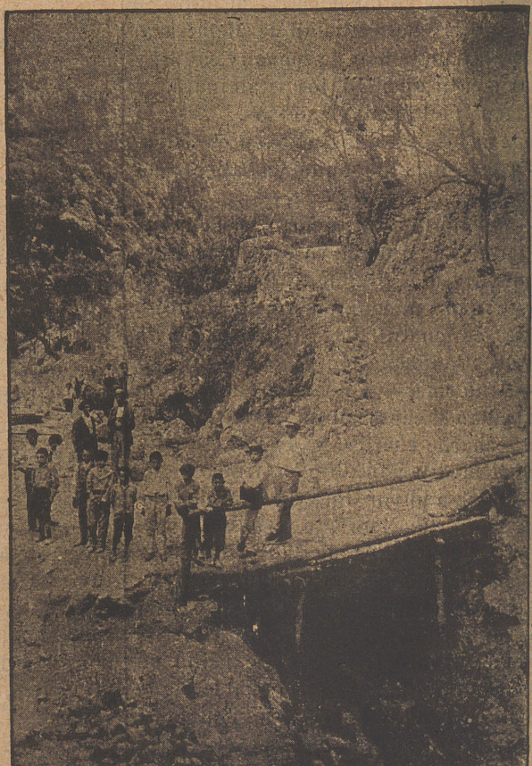
Detalle de las obras a la salida del túnel. La montaña que se vé a la izquierda pertenece a la finca «El Teix», en donde se han efectuado ya parte de las obras de explanación y en cuyo terreno se ha abierto una gran cantera.

Los que no gozan de tan exuberante fantasía tendrán que aguardar más tiempo para realizar en tren el pintoresco viaje a Sóller; pero ya llegará ese momento. Los sollerenses lo aguardan con ansiedad. Acarician, como se acaricia un dorado sueño, el día grande de la inauguración del ferrocarril, la obra que ha de enseñar a todos lo que puede hacer un pueblo cuando le anima una voluntad persistente, férrea. Nosotros también deseamos la llegada de ese día. ¡Pasajeros, al tren! Que se oiga pronto ese vibrante grito, que ha de sonar a canto triunfal.