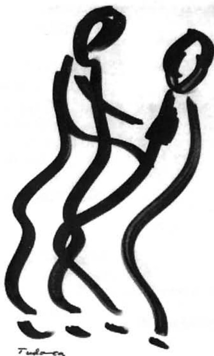
Dibuix de Tudanca, (sèrie preescultòrica)