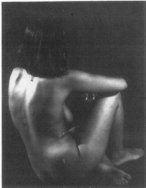
Nu