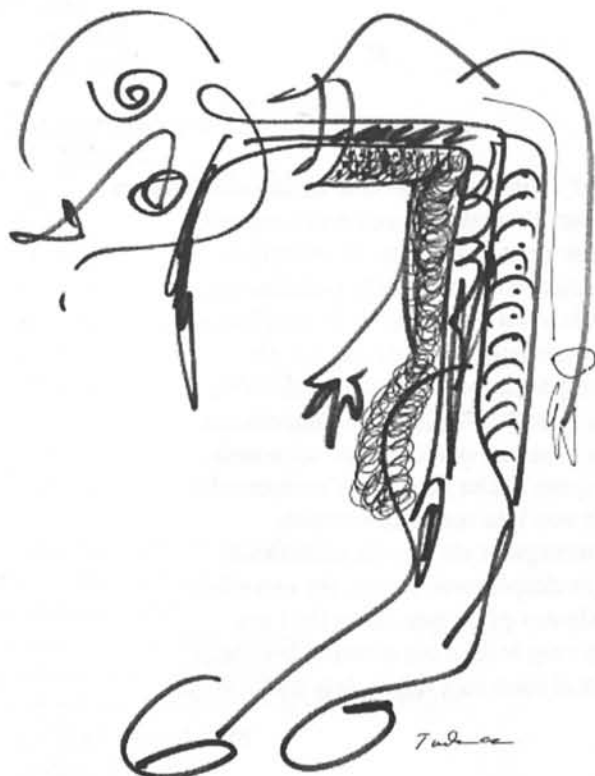
Il·lustració de Tudanca

(1) Al Pròleg del llibre Els colors i el zodíac , (Premi Festa d'Elx, 1987), publicat, --el 1990--, dins la col·lecció Balenguera per l'Editorial Moll.