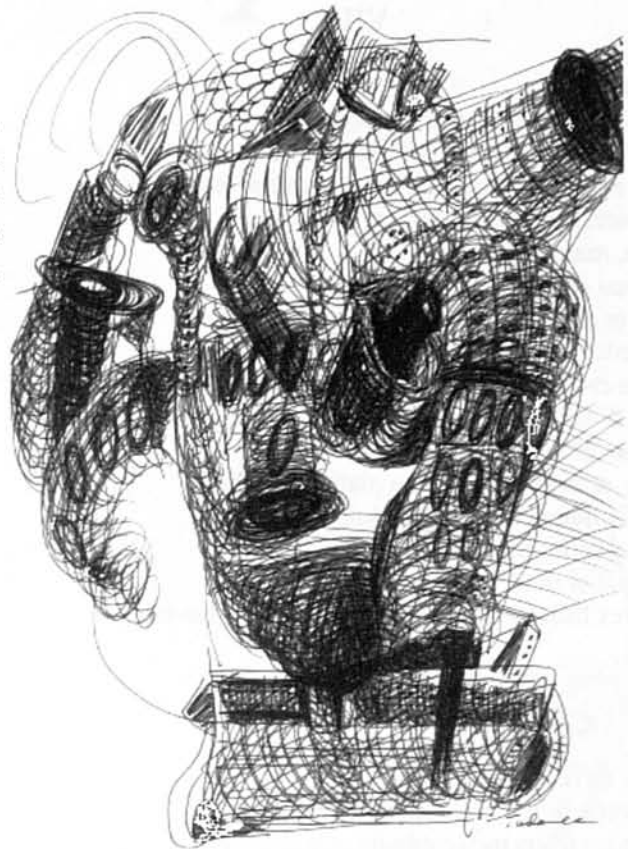
Dibuix de Tudanca

Si de cas buit, silenci, oblit, Sol i calma i nit, una roda futura on els mandats siguin fàcils, sens dol.