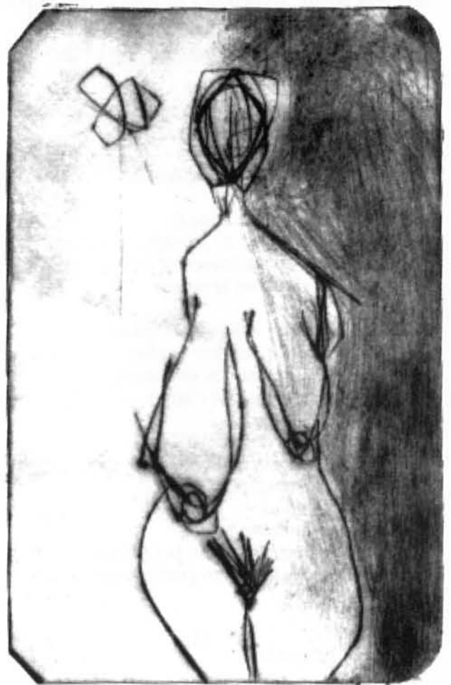
Gravat de Bel Font

I malgrat tot, et veig encara que no hi siguis, com plegues la flassada del meu taüt amb unes mans com un cel enorme, [ amant i mare, i els niguls que et coronen són la porta més estimada per eixir de l'infern que és el meu jo, pres de la crueltat d'un mal dia.