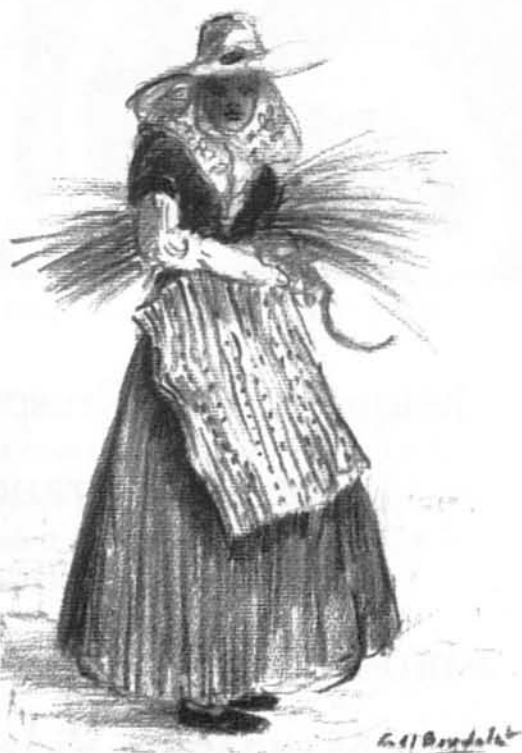
Segadora de Coll Bardalet

Per Sant Joan, les prunes no trobaran escala ni ganxo ni paner. A final d'estiu plourà, les figues de moro inflaran i, tanmateix, no en menjarem: sense tu seran amargues i salabroses.