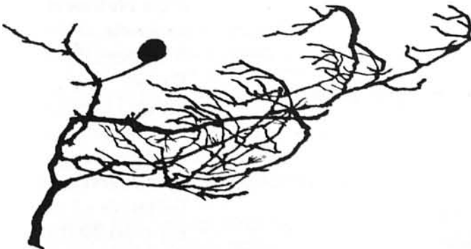
De Els colors i el zodíac (1990)

La vida és vent, temors, reminiscències i atàvics capiscols que dirigeixen un himne absurd. I la mirada neta, quimeres, laberints, colors, miratges, l'atreviment de no capitular.