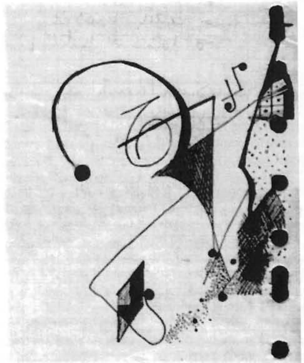
Il·lustració de Magdalena Vidal