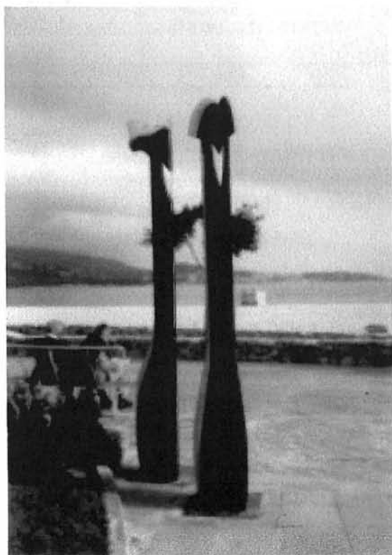
Grup escultòric de Gaspar Servera a Son Maties (Calvià)

Del llibre L'obscura ànsia del cor , editat per la Universitat de les Illes Balears (UIB) en la col·lecció Poesia de paper .