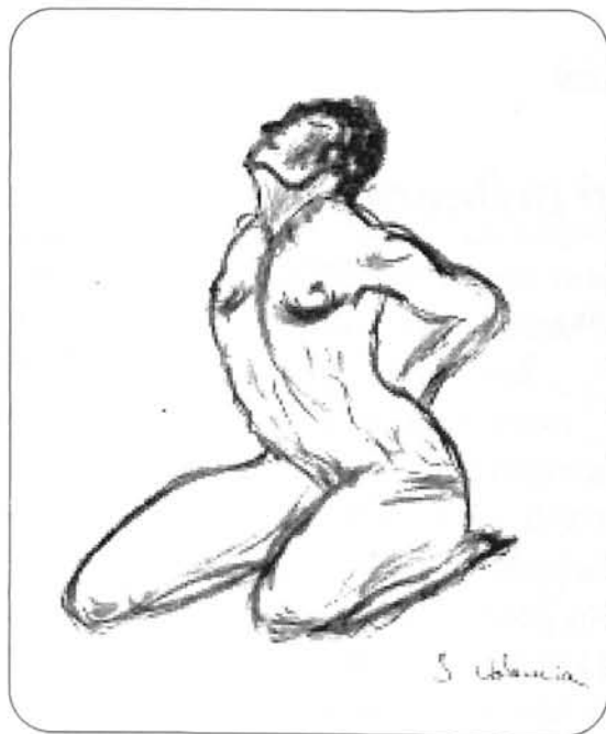
Dibuix de J. Valencia

sang i braó. Aleshores sentors rodaran clau, paisatge que conhorta el paradís serà lloc de ofertors.