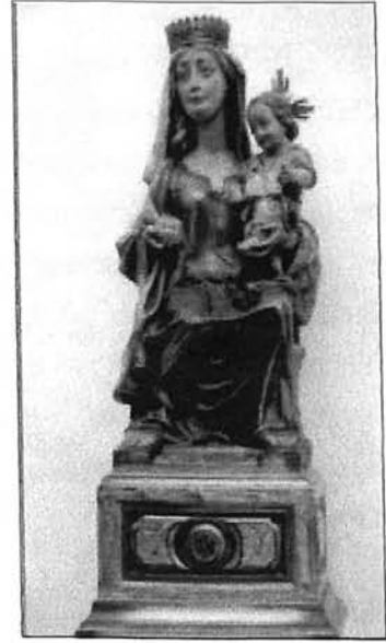
Mare de Déu de la Panada

La multitud resta ja assadollada; dotze cistelles curulles de bocins són mostra patent del prodigi.