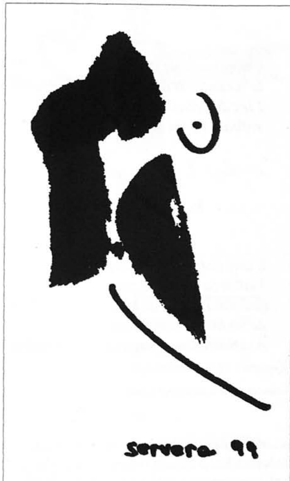
Il·lustració de Gaspar Servera