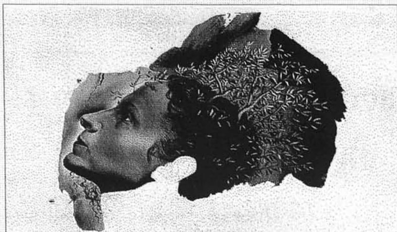
Començament automàtic d'un retrat inacabat de Gala. Dalí, (1932)

Veig com la barca lentament es confor/ amb la tènue línia de l'horizon on el sol dels dies curts dorm. La barca gira envoltada d'escuma/ mentre jo qued aquí solitari al portet.