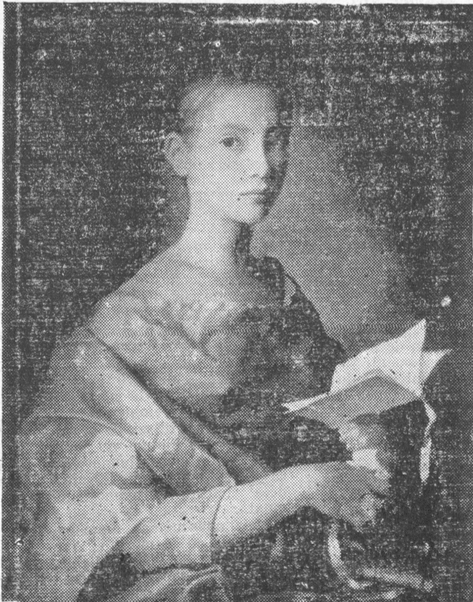
«Retrato de una desconocida», pintado en transparencia y con luz interior italiana por Elisabeth Bucher.