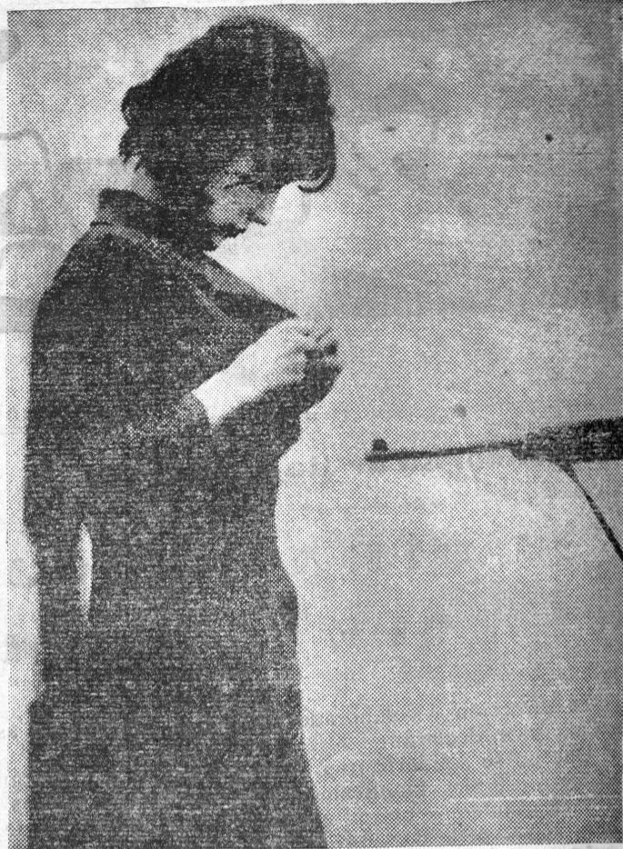
«Mourir en choisissant soi-même le sens de sa mort, c'est être le témoin de sa propre immaculée conception.» (Photo du film de Jean-Luc Godard, «Les Carabiniers».)

Les hommes de notre génération en qui le désir de violence se nourrit d'une égale exigence de pureté peuvent, s'ils réapprennent à le vouloir et s'ils le veulent, retrouver, dans le mystère même du temps de notre vie, tout ce qu'il faut pour que leur passion la plus impitoyable parvienne à cette pointe d'incandescence et d'abandon à elle-